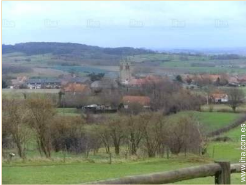
vista sobre el pueblo