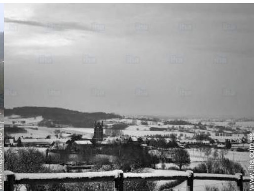
vista sobre el centro del pueblo