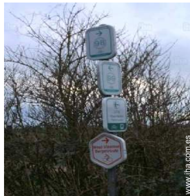
instalación de ocio