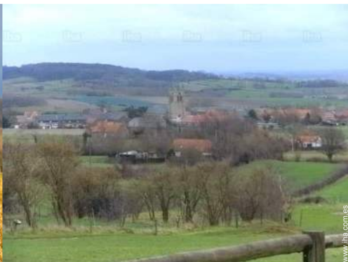
vista sobre el pueblo