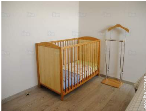
instalaciones de bebé