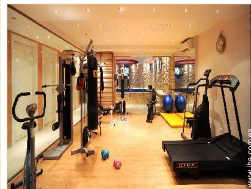
sala de deporte