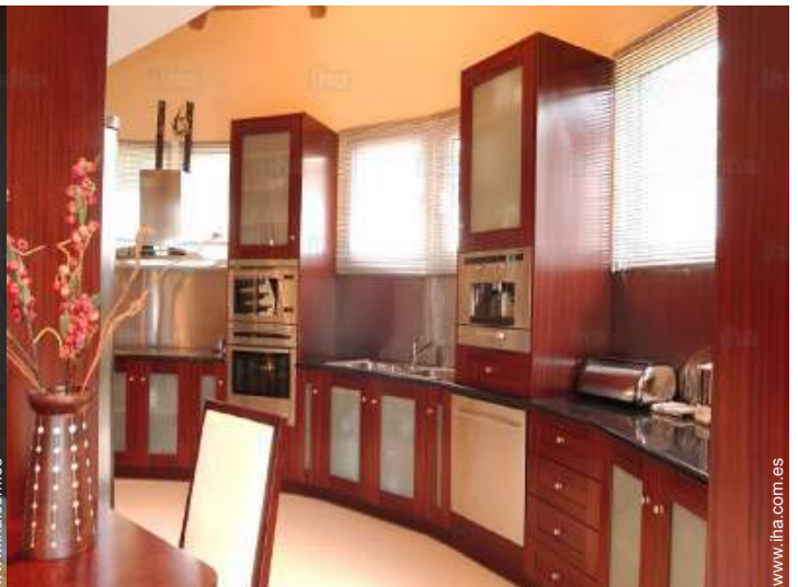
utensilios de cocina