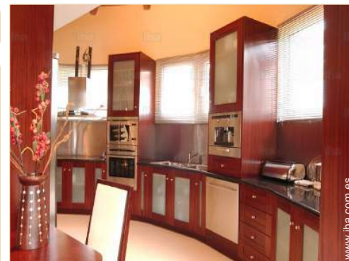
utensilios de cocina

Cocina exterior, salón de té, bar exterior, horno de pizza, barbacoa, mesa(s) de jardín, 30 silla(s) de jardín, carrito, sombrilla, área de jardín, balancín, columpio, columpio, parque infantil con arena, ducha exterior, servicio exterior