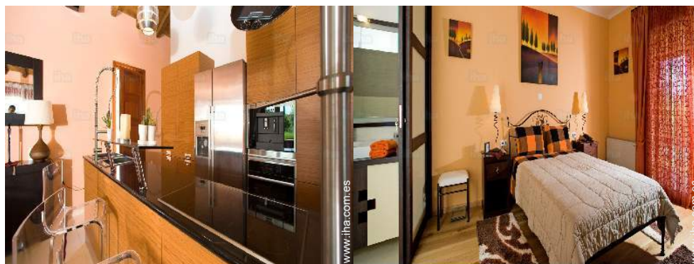
utensilios de cocina