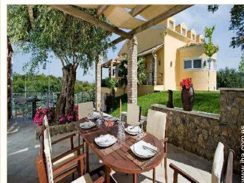
Chalet de Lujo