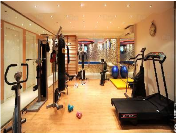
sala de deporte