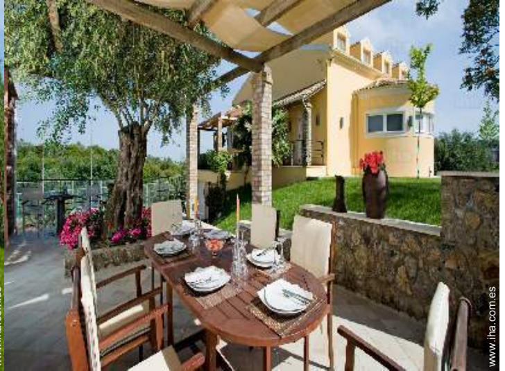
Chalet de Lujo