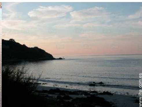
vista sobre la apuesta del sol