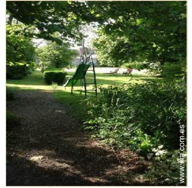
vista sobre el jardín/parque