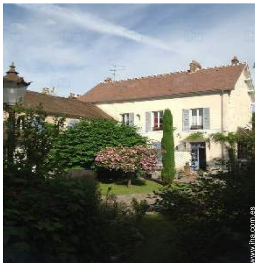
vista desde el jardín/parque