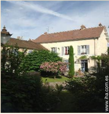
vista desde el jardín/parque