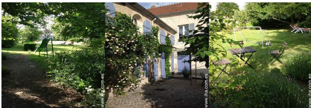
vista sobre el jardín/parque