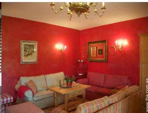
sala de televisión