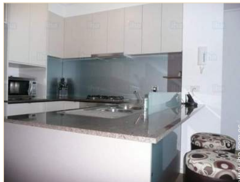
área de cocina