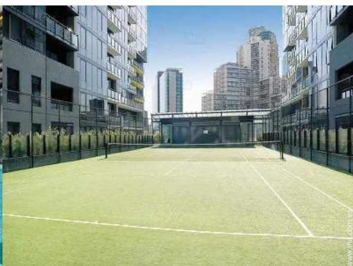
Tenis - superficie sintética