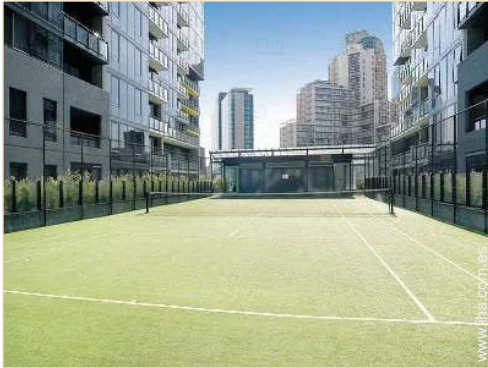
Tenis - superficie sintética