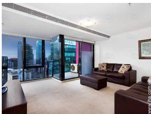
cuarto de estar