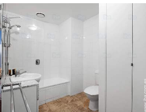
cuarto de baño