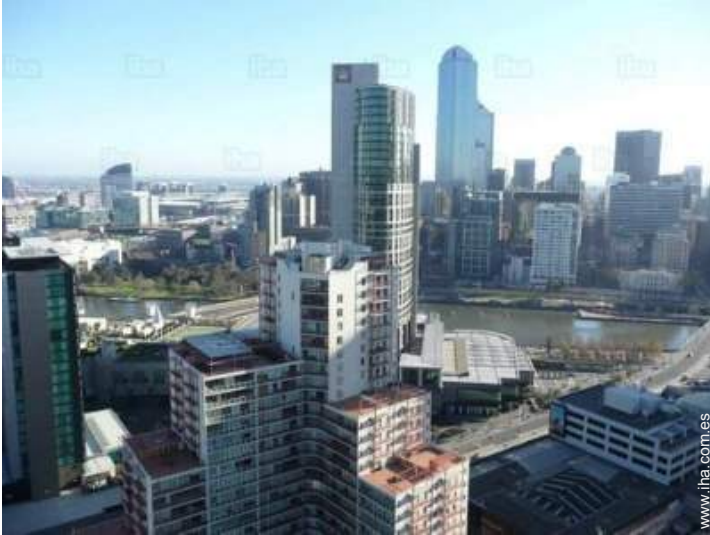
vista sobre el río