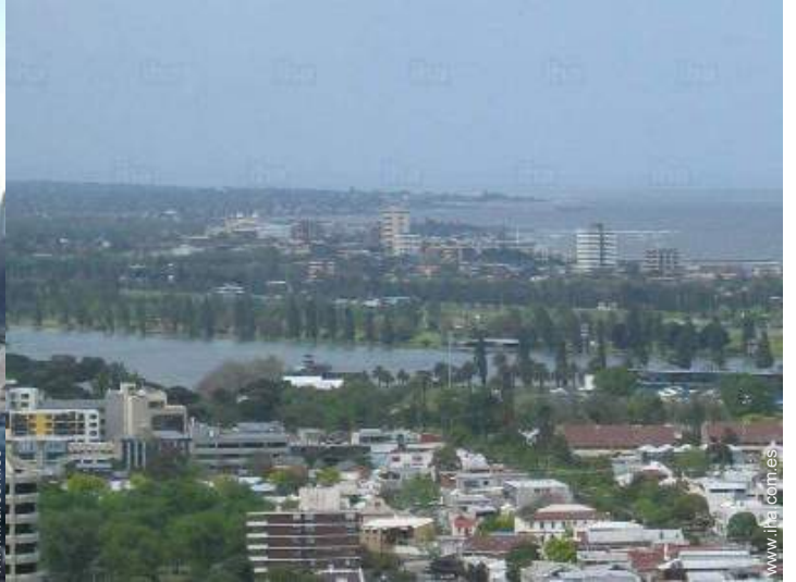
vista sobre el lago