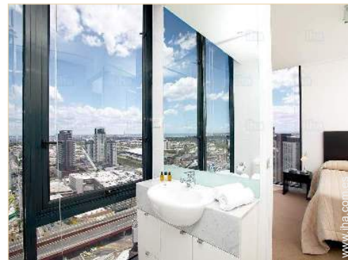
cuarto de baño