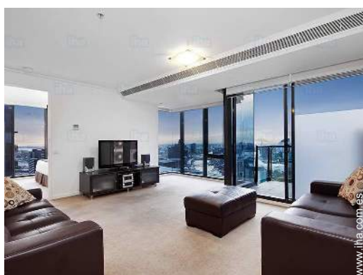
cuarto de estar