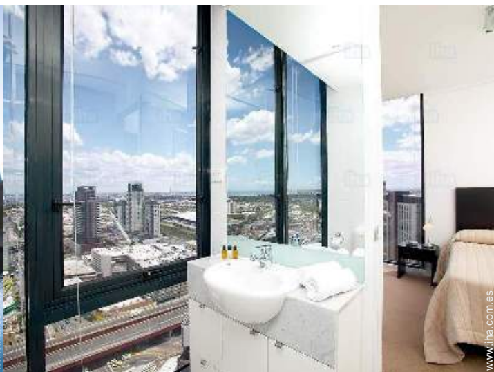
cuarto de baño