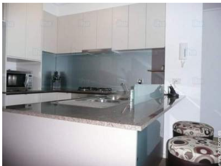
área de cocina