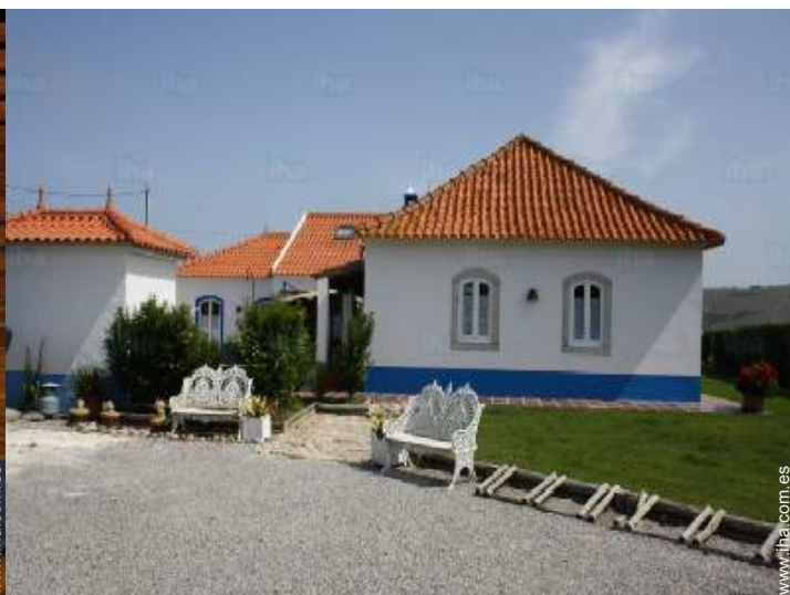
vista de la propiedad