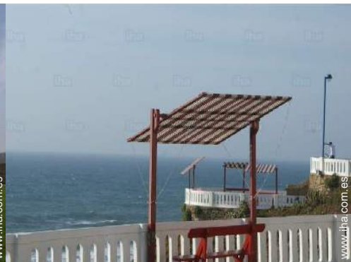
playa de arena