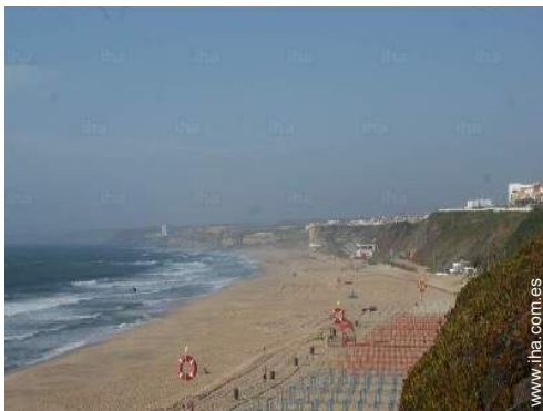
playa de arena