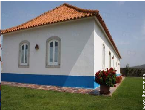
vista sobre el jardin/parque