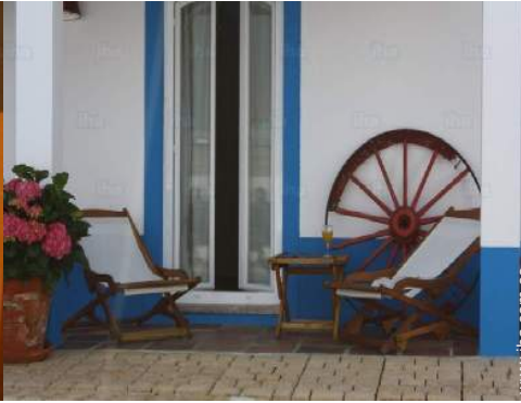
Instalaciones de ocio