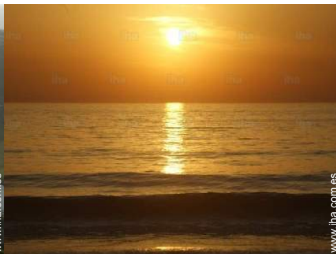
playa de arena