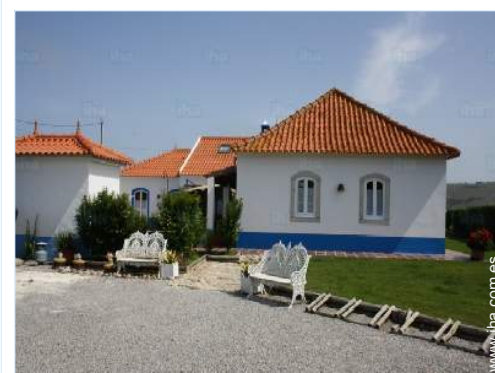
vista de la propiedad

Centro del pueblo 800m El centro 15km Parada/estación de autobús 800m Alquiler de coche 15km Panadería 800m Catering 800m Pequeños comercios 800m Supermercado 3km Cajero automático 800m Farmacia 800m Hospital 15km Dispensario 7,5km