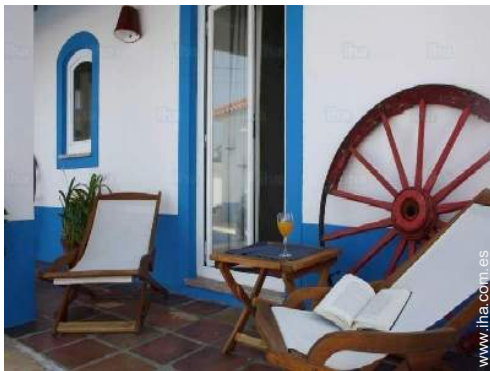
Instalaciones de ocio