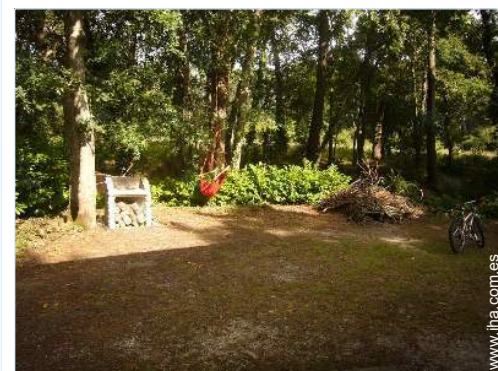
vista sobre el bosque