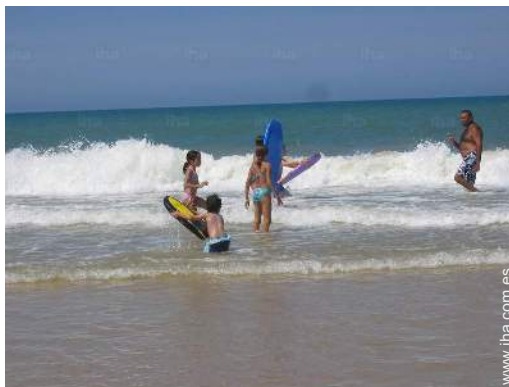
vista sobre el océano