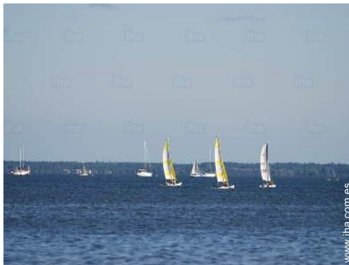
actividades náuticas cercanas