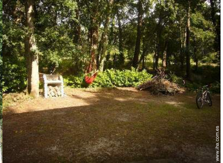
vista sobre el bosque