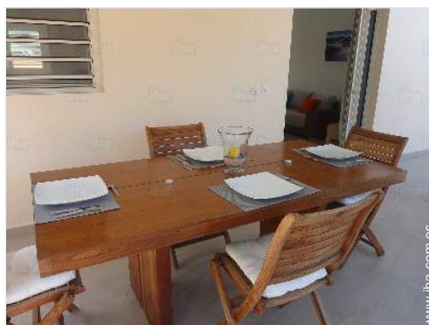
Confort interior e instalaciones