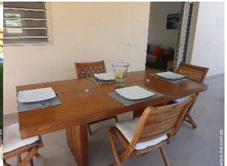
Confort interior e instalaciones