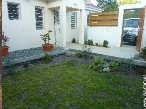
vista desde el jardin/parque