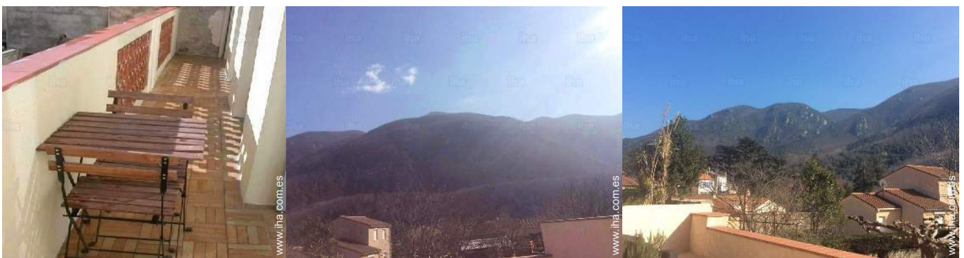
vista desde le piso