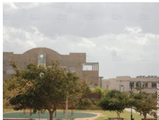
vista sobre el jardin/parque