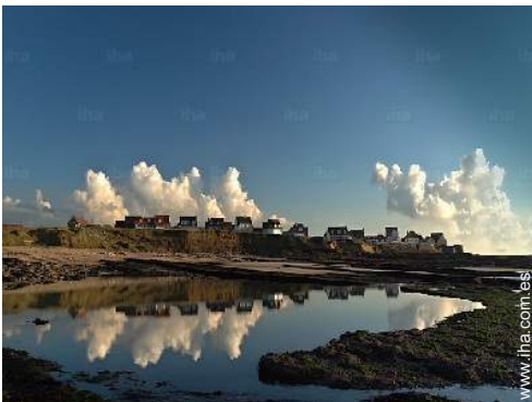
playa de roca