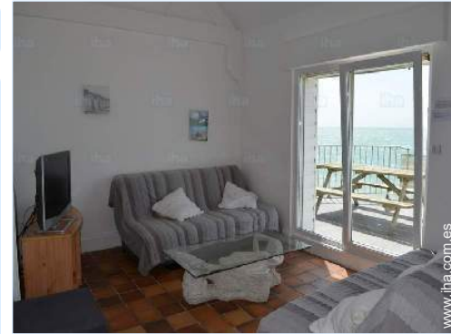
sala de televisión