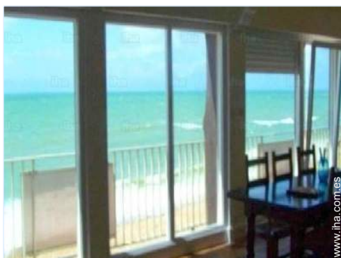
vista desde le piso