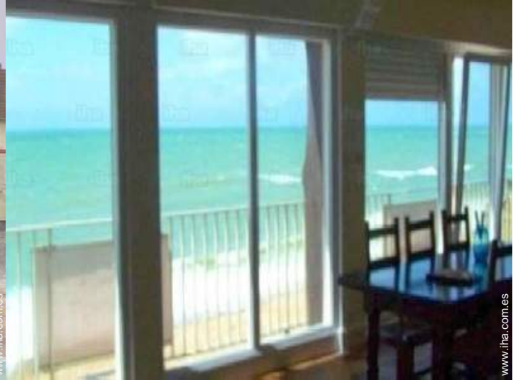
vista desde le piso