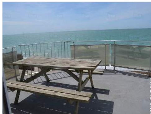
vista desde la terraza