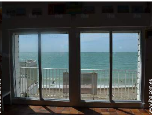
vista desde le piso