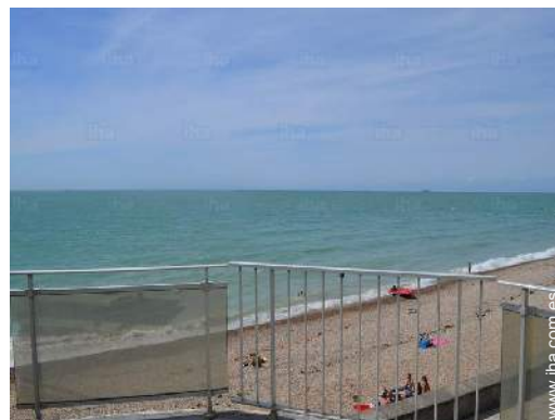
vista desde le piso