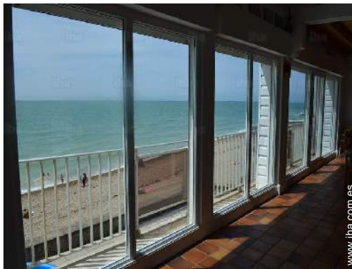
vista desde le piso