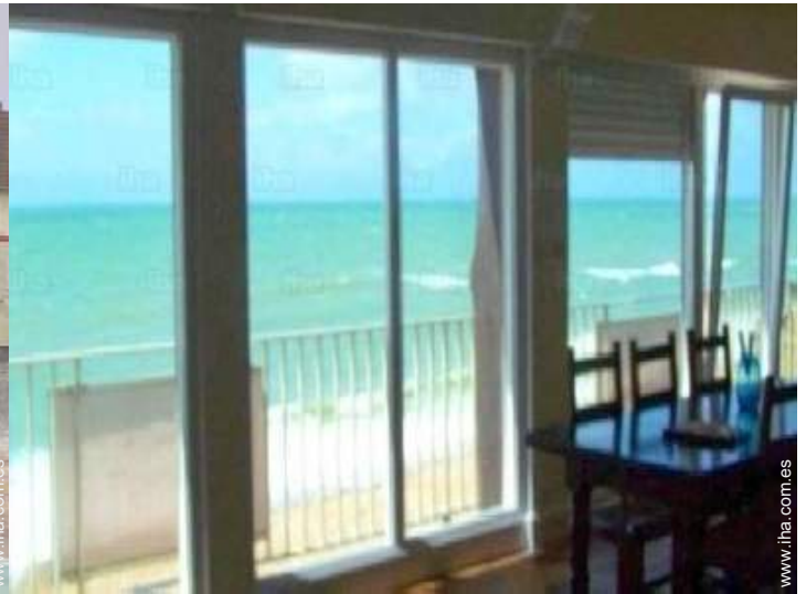
vista desde le piso