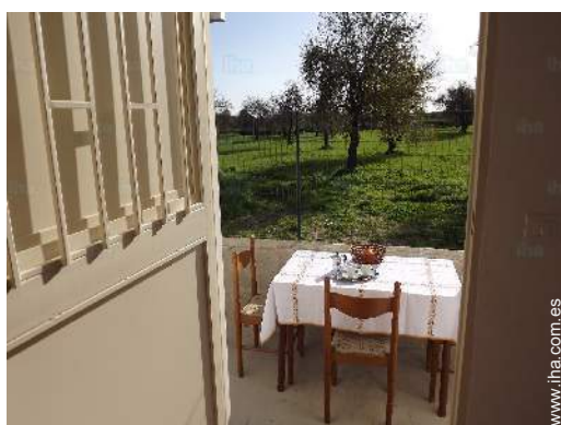
vista desde le piso