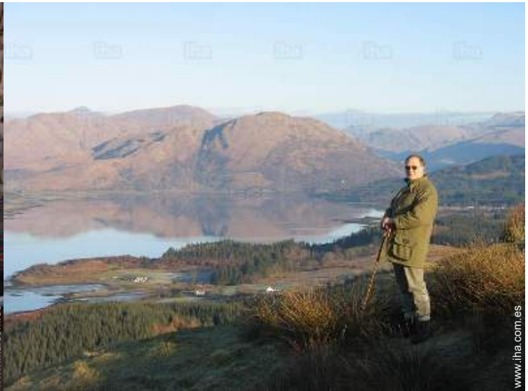
vista sobre el campo