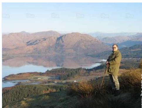
vista sobre el campo