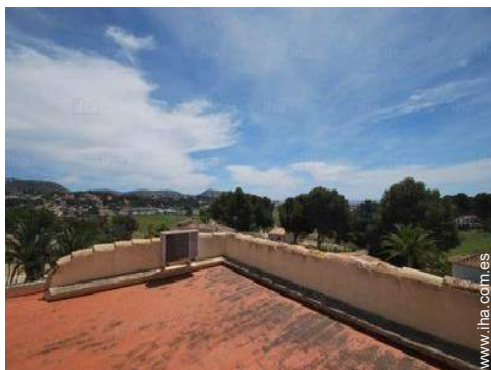
vista desde la azotea