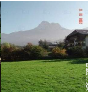
vista desde la casa