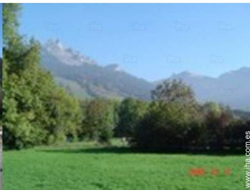
vista desde la casa