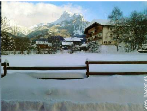
vista de la propiedad