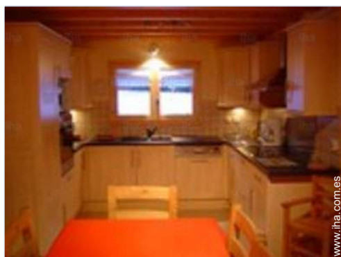
gran cocina americana