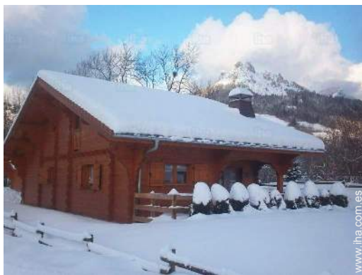
vista de la propiedad