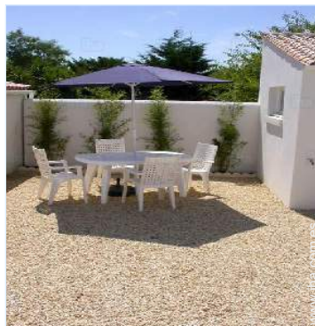
área de jardín