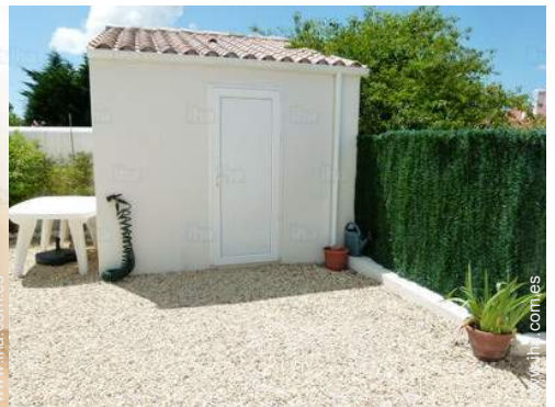
instalación de ocios