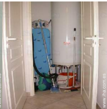
Instalaciones a disposición