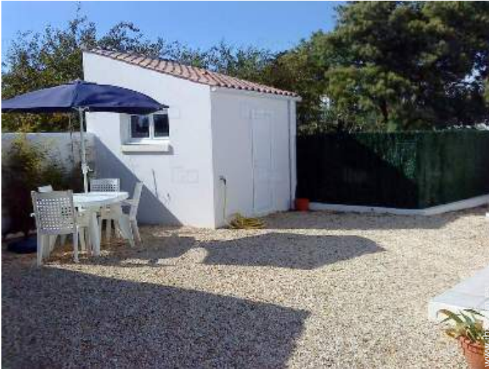
vista sobre el patio