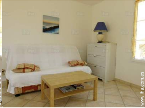
sofá cama 2 pers