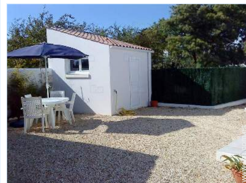
vista sobre el patio