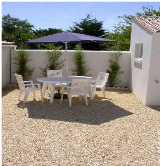
área de jardín