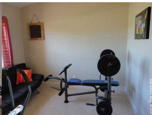
sala de deporte