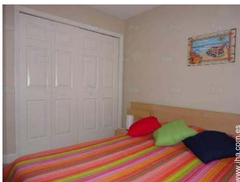
cuarto de invitados