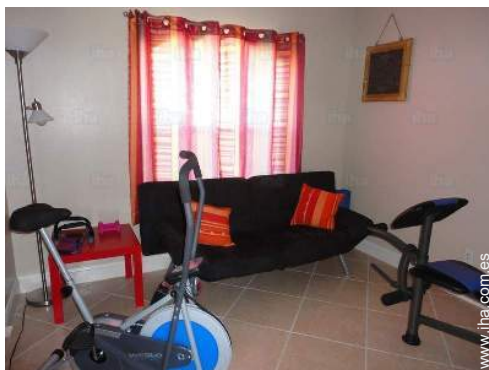
sala de deporte