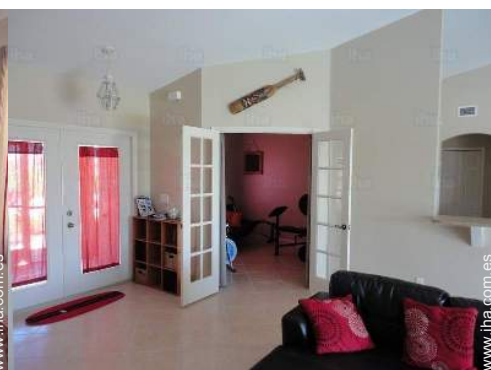
sala de deporte