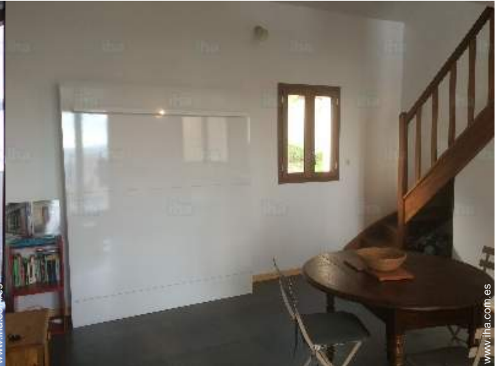
cama(s) mueble(s) 2 pers