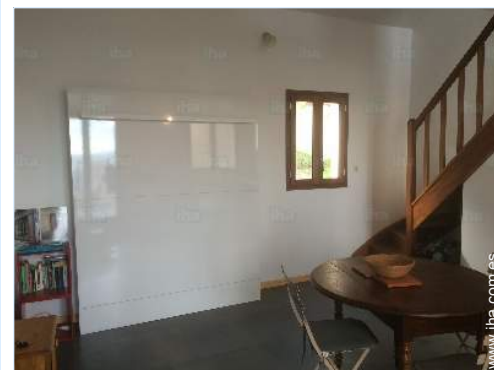
cama(s) mueble(s) 2 pers

Alquiler de bici/MTB 15km Alquiler de barco 15km Alquiler de equipo de buceo 15km Alquiler de colada/lavandería 15km Panadería 3km Pequeños comercios 3km Supermercado 7,5km Peluquería 7,5km Correos 7,5km Cajero automático 15km Farmacia 7,5km Médico 7,5km Enfermera 7,5km Hospital 25km