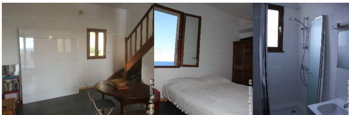
cama(s) mueble(s) 2 pers