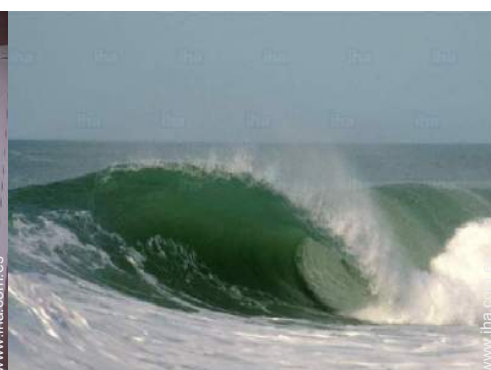
spot de surf