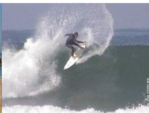
spot de surf