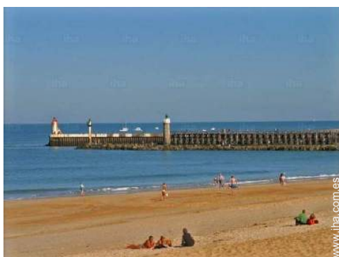
playa de arena