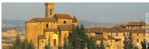
centro del pueblo