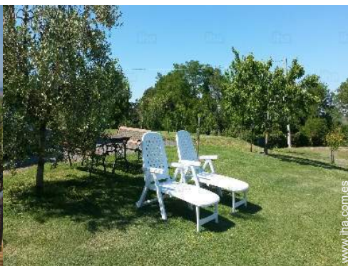
vista desde el jardín/parque