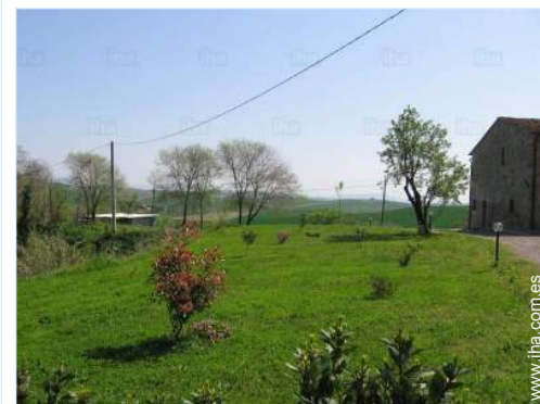
vista desde el jardin/parque

Centro del pueblo 800m Parada/estación de autobús 800m Panadería 800m Pequeños comercios 800m Supermercado 10km Peluquería 800m Correos 800m Banco 800m Farmacia 800m Médico 800m Hospital 25km