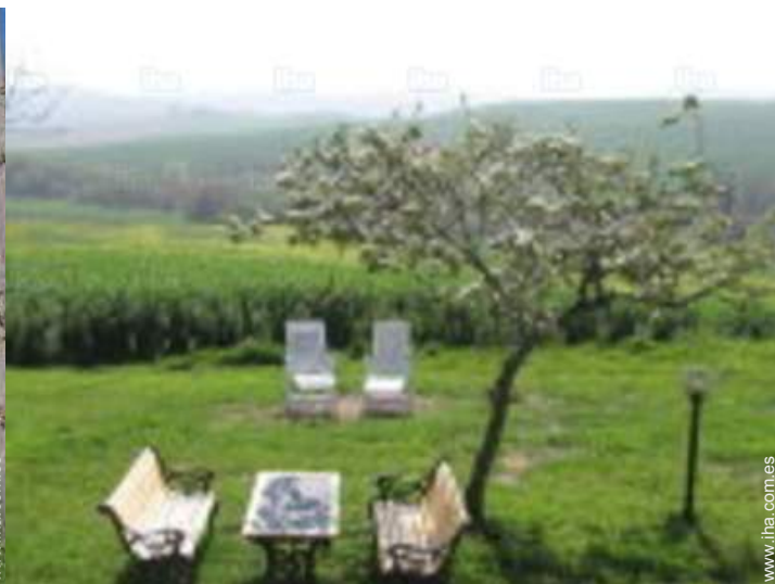
vista desde el jardin/parque