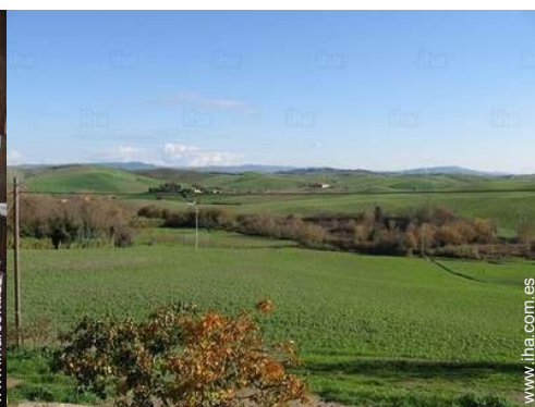
vista de la propiedad