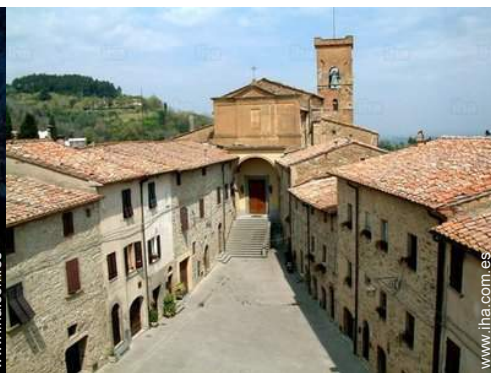
centro del pueblo