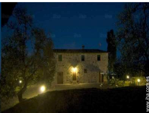
vista de conjunto