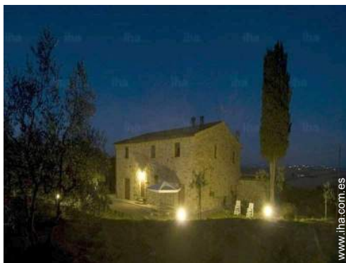
vista de conjunto