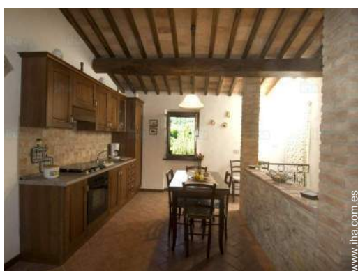
área de cocina