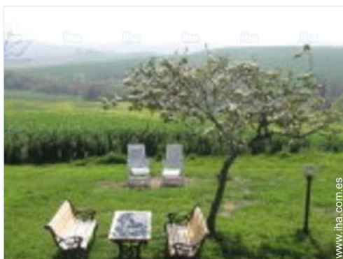
vista desde el jardin/parque