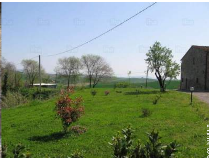
vista desde el jardin/parque