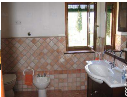
cuarto de baño