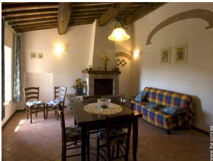
vista desde el cuarto de estar