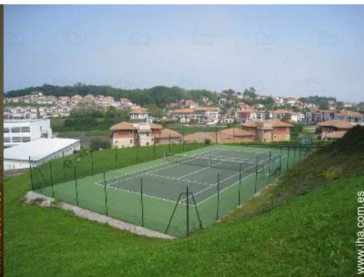
tenis en la residencia