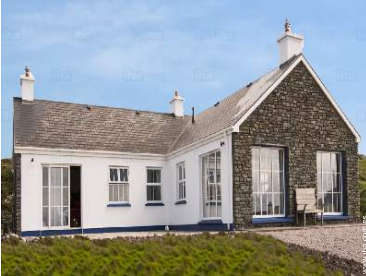
vista de la propiedad