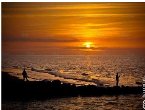
vista sobre el océano