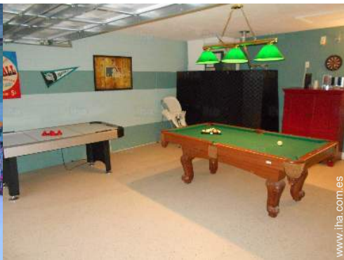
sala de juegos