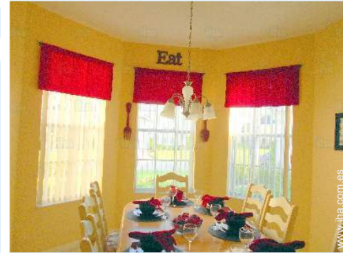
gran cocina americana