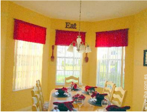
gran cocina americana