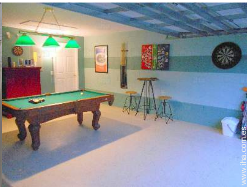
sala de juegos