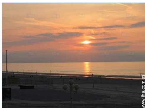
vista sobre la puesta del sol