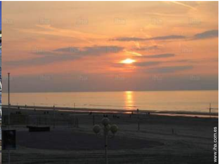
vista sobre la apuesta del sol