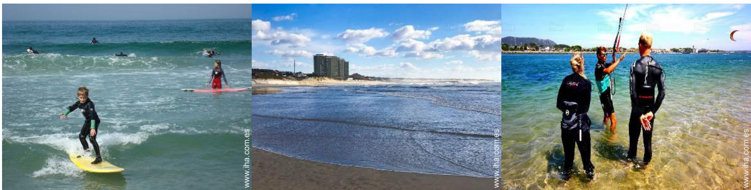
actividades náuticas cercanas