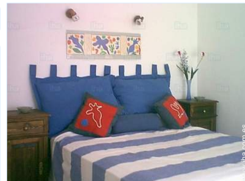
habitación del propietario

Barbacoa, mesa(s) de jardín, 10 silla(s) de jardín, sombrilla, 4 reposera(s), ducha exterior