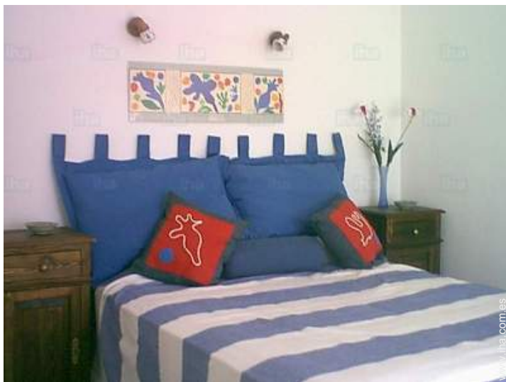
habitación del propietario