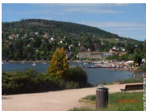
camino para pasear