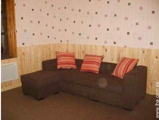
sofá cama 2 pers