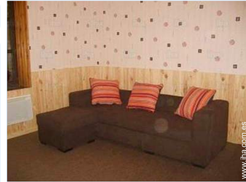
sofá cama 2 pers