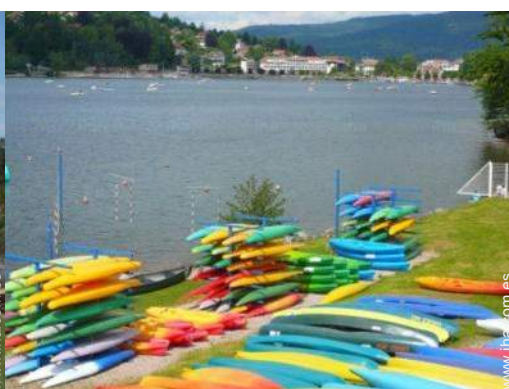
actividades náuticas cercanas