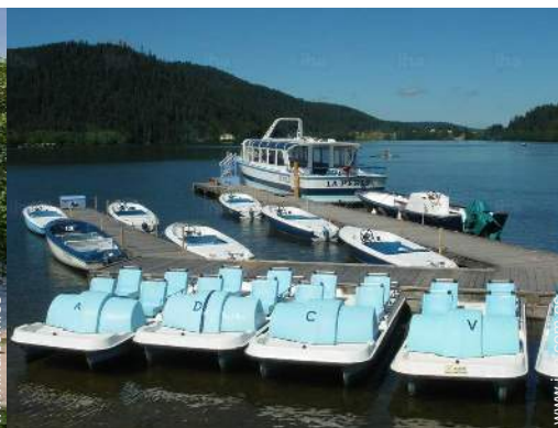
barca a pedal