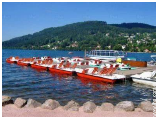
barca a pedal