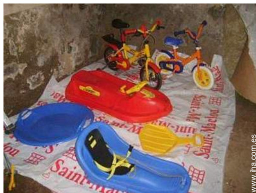
local de esquí