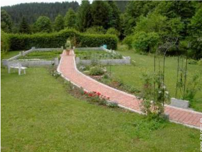
vista sobre el jardin/parque