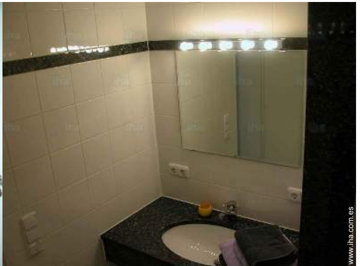
cuarto de baño