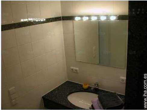
cuarto de baño