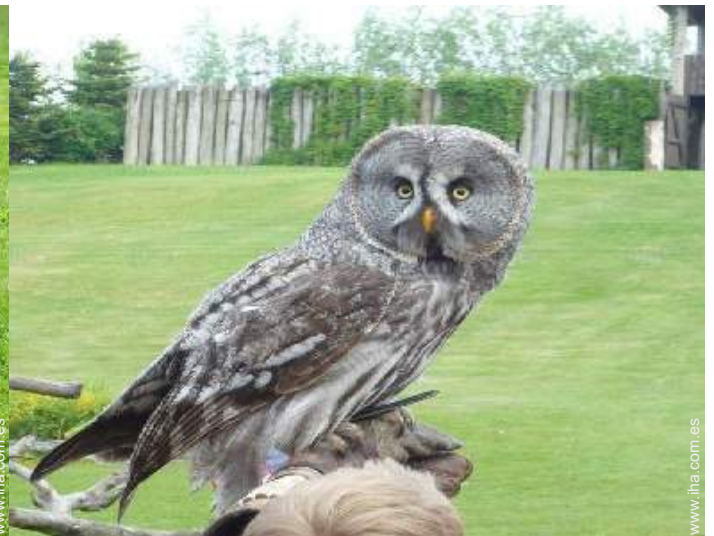
zoo/parque de animales