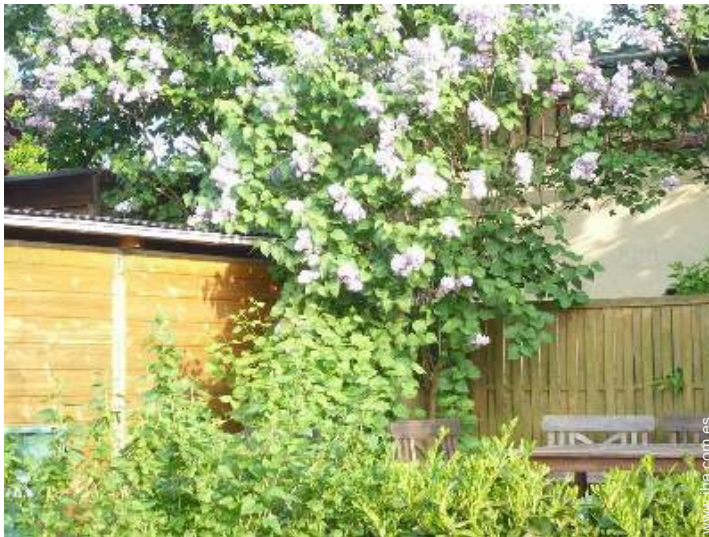
silla(s) de jardín