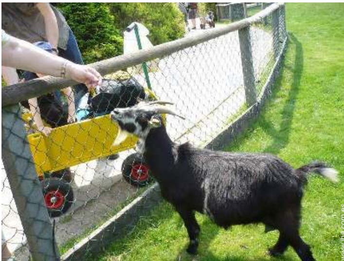
zoo/parque de animales