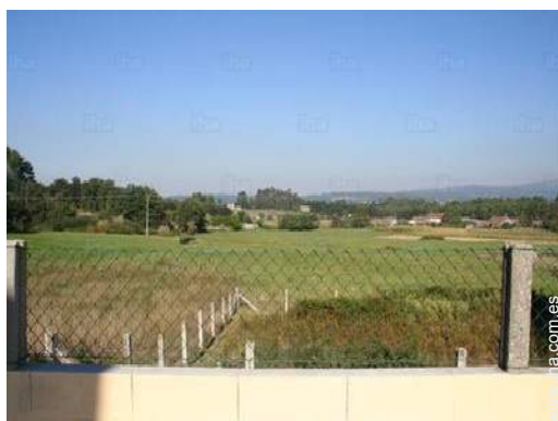
vista sobre pradera