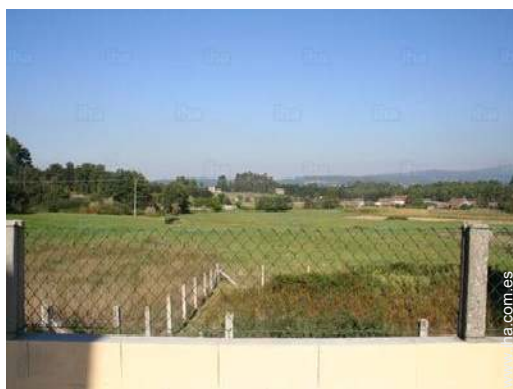
vista sobre pradera