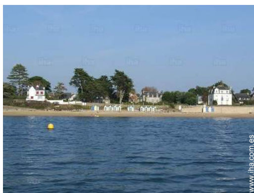
acceso directo playa