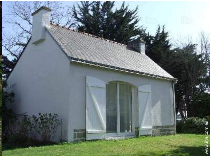
Marco exterior a disposición de los huéspedes