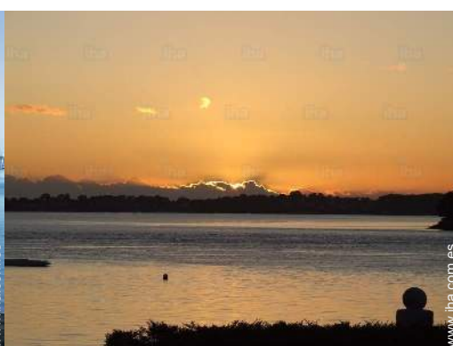
vista sobre la puesta del sol