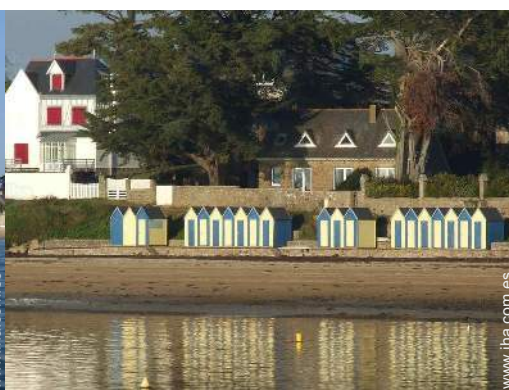
acceso directo playa