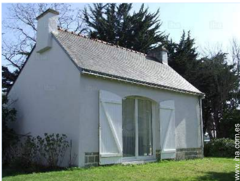
Marco exterior a disposición de los huéspedes