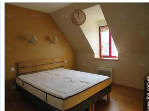
habitación del propietario

Centro del pueblo Alquiler de bici/MTB Panadería 200m Pequeños comercios 200m Supermercado 500m Peluquería 500m Correos 500m Farmacia 3km Médico 800m Enfermera 500m Hospital 20km