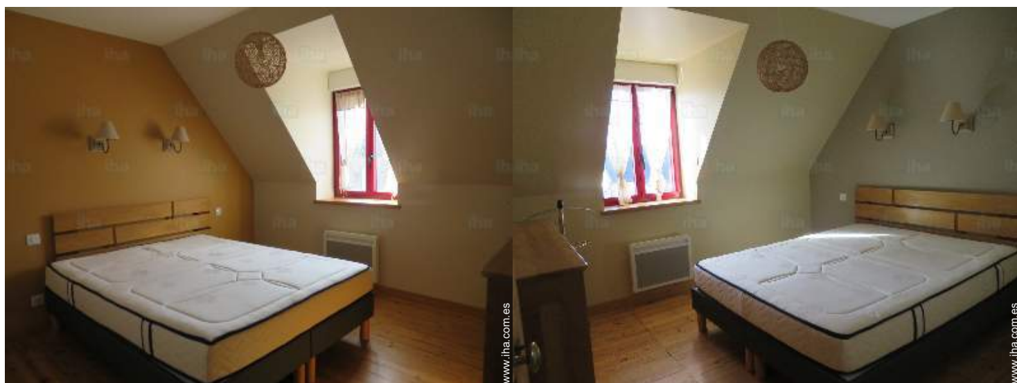
habitación del propietario