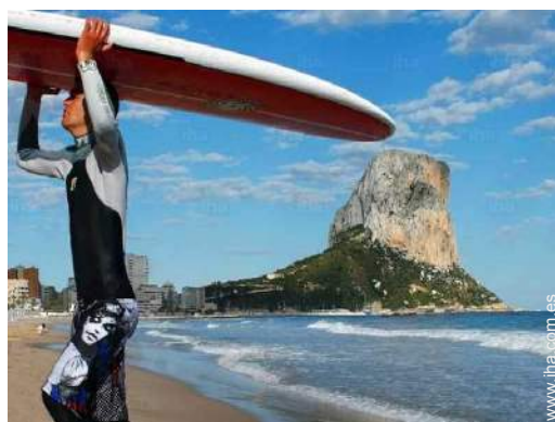
actividades aéreas cercanas