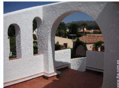
vista desde la azotea