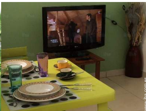
vista desde le piso