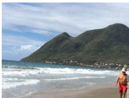
actividades náuticas cercanas