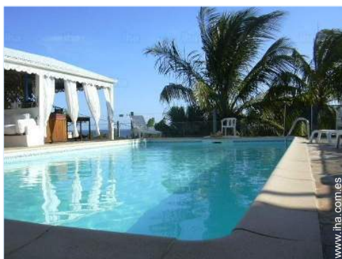
vista desde la piscina