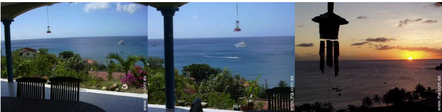
vista sobre el mar