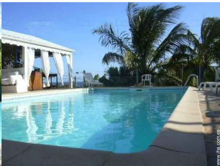
vista desde la piscina