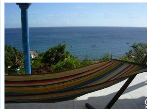
vista desde la terraza cubierta