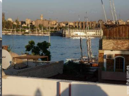
vista desde la azotea