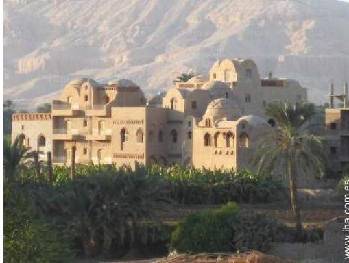
vista desde la azotea