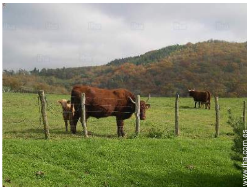
vista sobre el campo