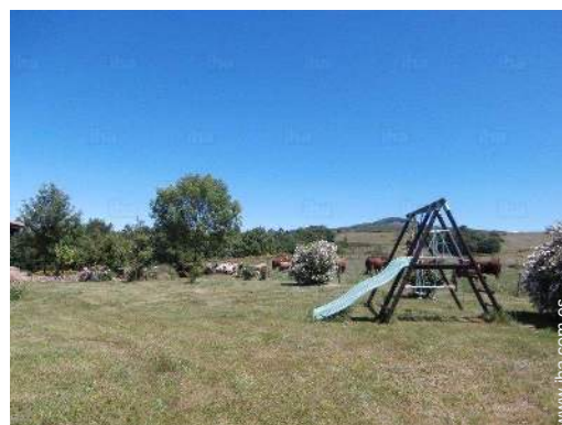
instalación de ocios