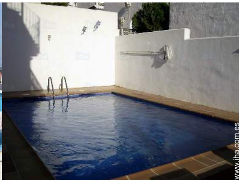
vista desde la piscina