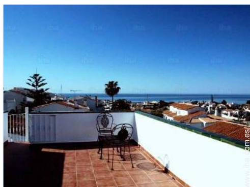
vista sobre las azoteas