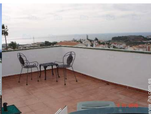
vista desde la azotea