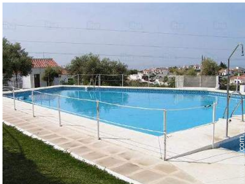
Instalaciones de ocio