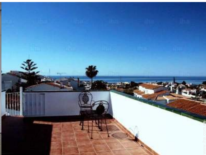
vista sobre las azoteas