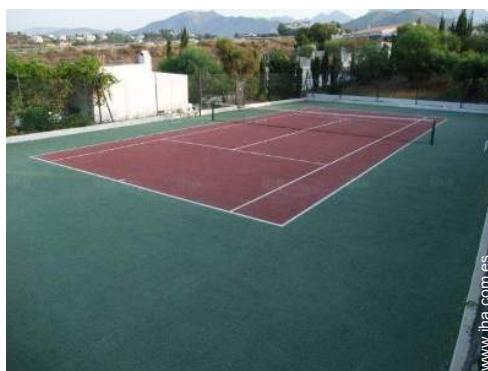
Tenis - superficie sintética