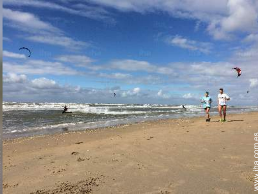
actividades de ocio de verano cercanas