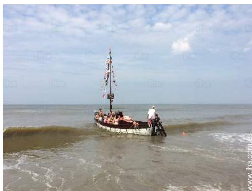
excursión en barco