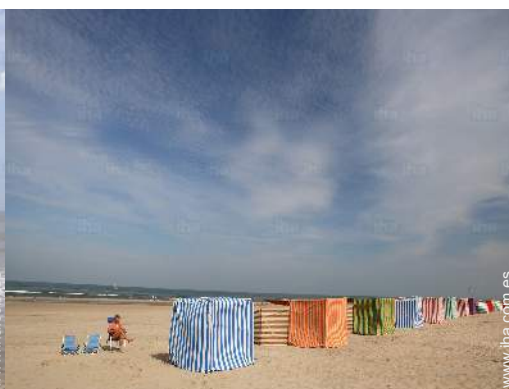
actividades balnearias cercanas