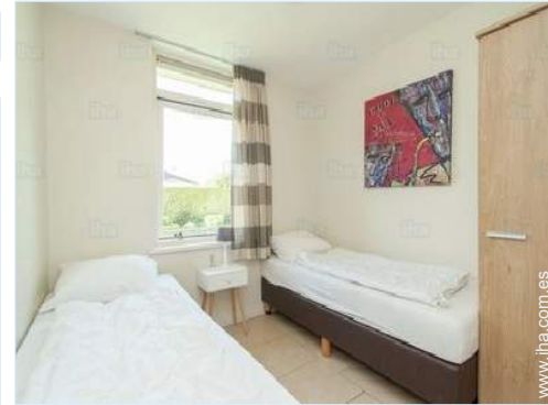
cuarto de invitados