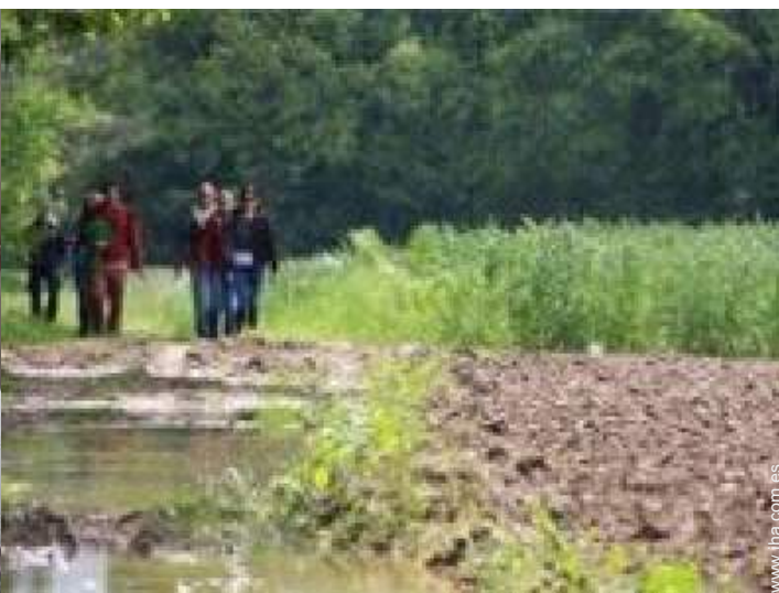
actividades de ocio cercanas