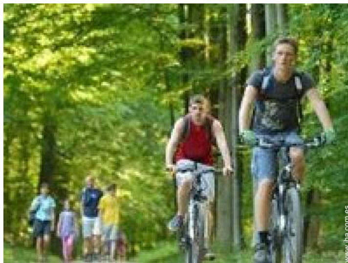
actividades de ocio cercanas