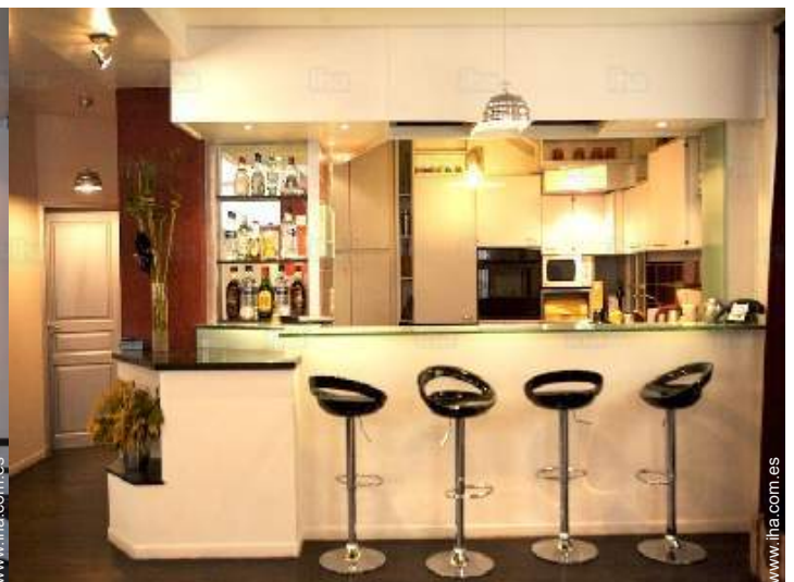
gran cocina americana