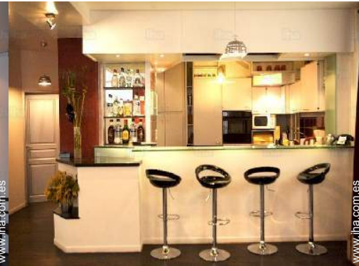
gran cocina americana