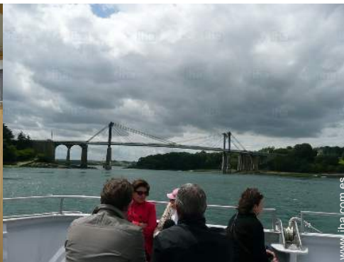
actividades náuticas cercanas