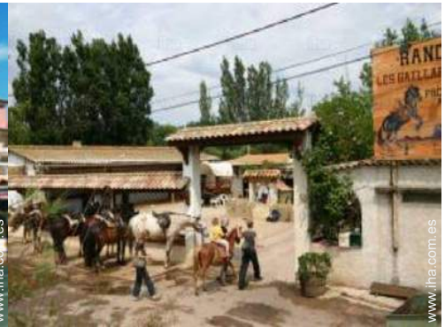
paseo a caballo