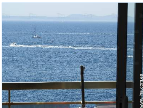
vista desde le piso