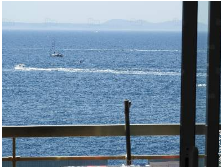
vista desde le piso